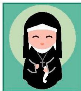
Joana de Lestonnac

Nasceu em 1556, em Bordeaux, França. Casou-se com Gastão de Monferrant, aos 17 anos, e tiveram 7 filhos.